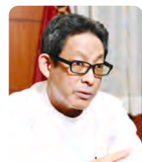
監修：渡邊 雄介先生